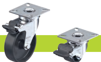
Abbildung mit Feststellhebel aus Kunststoff Abbildung Radfeststeller „Radstop“